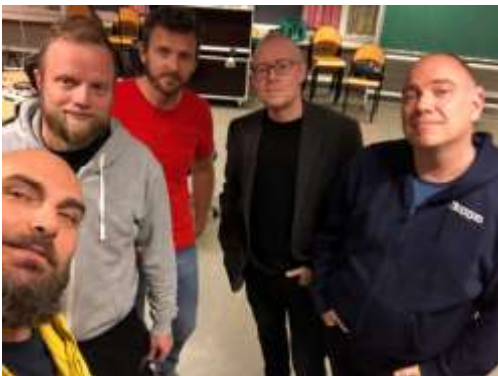
Hvidovre Lærerforenings fantastiske lærerband