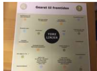
Udfordringer som oplæg til ”Er vi gearet til fremtiden”