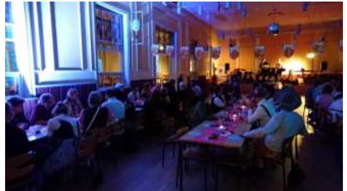
Oktoberfest på Risbjerggård

Vi regner bestemt med, at oktoberfesten bliver en tilbagevendende begivenhed. Risbjerggård er ved at blive ombygget/nedrevet, så i 2020 bliver oktoberfesten afholdt et andet sted.