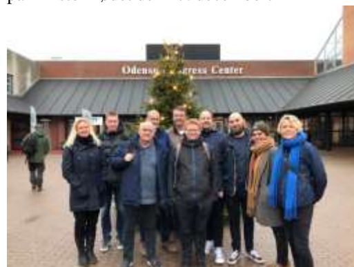
Hvidovre Lærereforenings deltagere på TR-stormødet den 17. december.